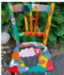
Sèverine Bugna peintre